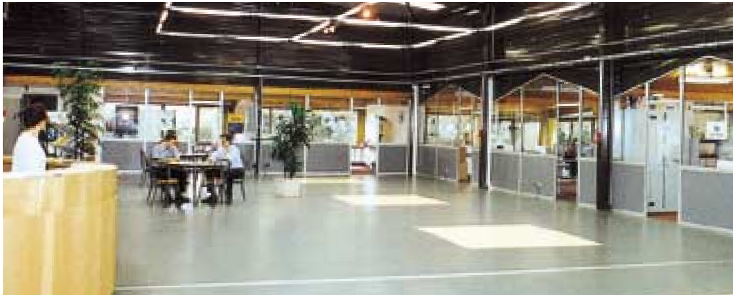
Partenaires du CEEI Gers Gascogne : CCI d'Auch et du Gers, Conseil Général du Gers, Ville d'Auch, Communauté Save Lisloise, Communauté Lomagne Gersoise, Eauze, Riscle, Vic-Fezensac, EDF Pyrénées Gascogne.

Ouverte en septembre 1999, la pépinière du CEEI Gers Gascogne est dédiée à l'accueil d'activités proposant des services ou produits exploitant les Nouvelles Technologies d'Information et de Communication ; elle dispose de 1000 m 2 de locaux relais à usage de bureaux, plateaux tertiaires et ateliers polyvalents et propose des services communs d'accueil, secrétariat, documentation, salles de réunion et conférence, cafétéria... L'ensemble du centre est équipé d'un câblage réseau informatique et télécommunicant avec accès mutualisé et sécurisé à Internet par liaison spécialisée haut débit (512 Kbs).