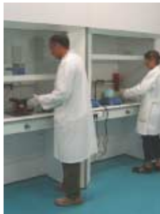
Le laboratoire de recherche.

Suivi et accompagné de façon conjointe par la pépinière d'entreprises CAP DELTA et l'Incubateur Midi-Pyrénées, ce projet est un exemple du partenariat régional mis en place entre l'Incubateur et le Réseau de Pépinières d'Entreprises de Midi-Pyrénées.