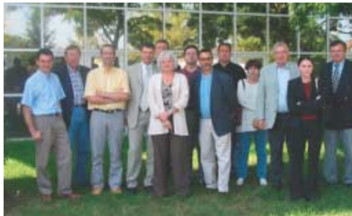
Les dirigeants des Pépinières d'Entreprises de Midi-Pyrénées.

une offre globale à destination des PME/PMI "Réussir un essaimage : des compétences et un réseau pour la création d'entreprises". Cette nouvelle opération a pour objectif d'offrir les meilleures garanties de succès en matière d'évaluation, d'accompagnement et de développement des projets issus de l'essaimage.