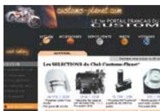
Page d'accueil du site web.

Contact : Christian HESPEEL - tel : 05.61.82.04.03 - site : www.customs-planet.com