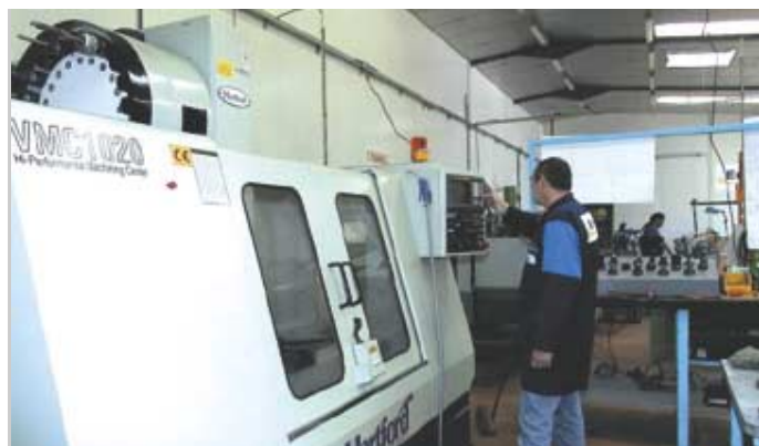
L'atelier de fabrication EROP.