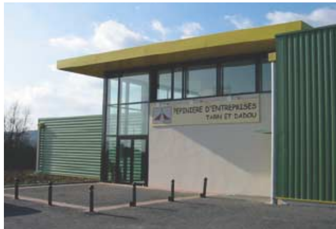
L'entrée de la pépinière TARN et DADOU à Gaillac (81).

Située à l'ouest du département du Tarn, à proximité de l'autoroute A68, la pépinière Tarn & Dadou occupe 2 sites : GAILLAC et GRAULHET.