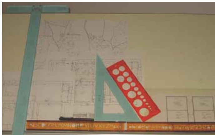
Les outils de l'économiste de la construction.

Contact : Nathalie BAGES-CABOT - Tél : 05.63.81.47.63 - e-mail : EMC-BAT@wanadoo.fr