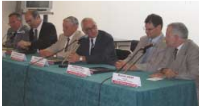
Le 9 juillet 2003, signature des conventions de partenariat à l'Hôtel de région.

Diagnostiques et expertises des projets : KPMG, cabinet conseil et d'expertises comptant sur le plan national 180 bureaux et près de 8.000 collaborateurs, s'est engagé à apporter un soutien à la prospection de projets auprès des PME/PMI et grandes entreprises de Midi-Pyrénées et à réaliser des diagnostics et expertises des projets issus de l'opération. Le Réseau de Pépinières et KPMG prévoient également de collaborer à l'organisation d'un