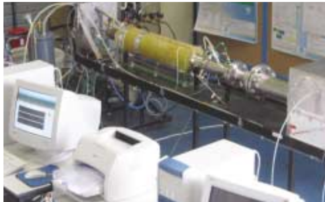
En arrière plan, le reformeur d'hydrogène.

Ces piles, connues pour leur excellent rendement, se prêtent parfaitement aux petites puissances. Faire de l'électricité à partir d'hydrogène est chose délicate, coûteuse et un rien polluant. Le tour de force de N-GHY, c'est de produire propre, sûr et à bon rendement. "On optimise le transfert de chaleur, et, à la place des catalyseurs, on utilise les hautes températures".