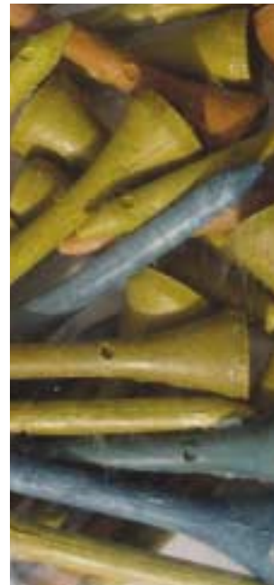
Tees de golf biodégradables.