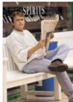
Avoir l'Esprit Presse...

L'entreprise a démarré grâce au soutien des journaux Investir et Défis qui lui ont confié plusieurs missions nationales et régionales. L'ESPRIT PRESSE a également obtenu la confiance du Revenu, d'Euronext et de M.P.S. (Midi Presse Service) pour la région Midi-Pyrénées.